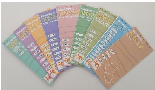
和歌山県街道マップ