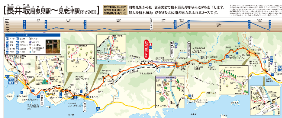
和歌山県街道マップコース例(熊野古道大辺路)